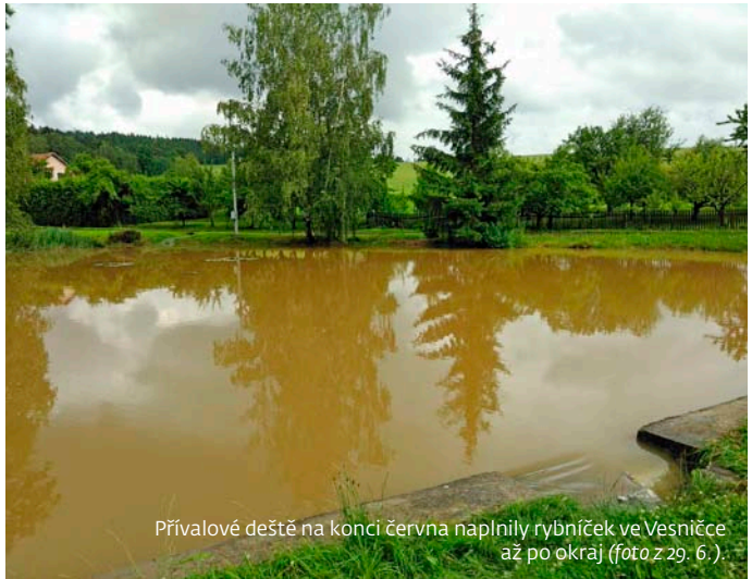
Přivalové deště na konci června naplnily rybníček ve Vesničce až po okraj (foto z 29. 6.)

o úhradu ztráty za minulý rok, která činí 1,8 mil. korun. Zastupitelé mají možnost ztrátu z hospodaření uhradit z obecního rozpočtu nebo požadovat po vedení, aby ztrátu postupně umožňoval kladným hospodařením v následujících letech. Zastupitelé uznali, že hospodaření domova letos ani v příštím roce nebude kladné, proto schválili ztrátu z hospodaření za rok 2019 uhradit z obecního rozpočtu.