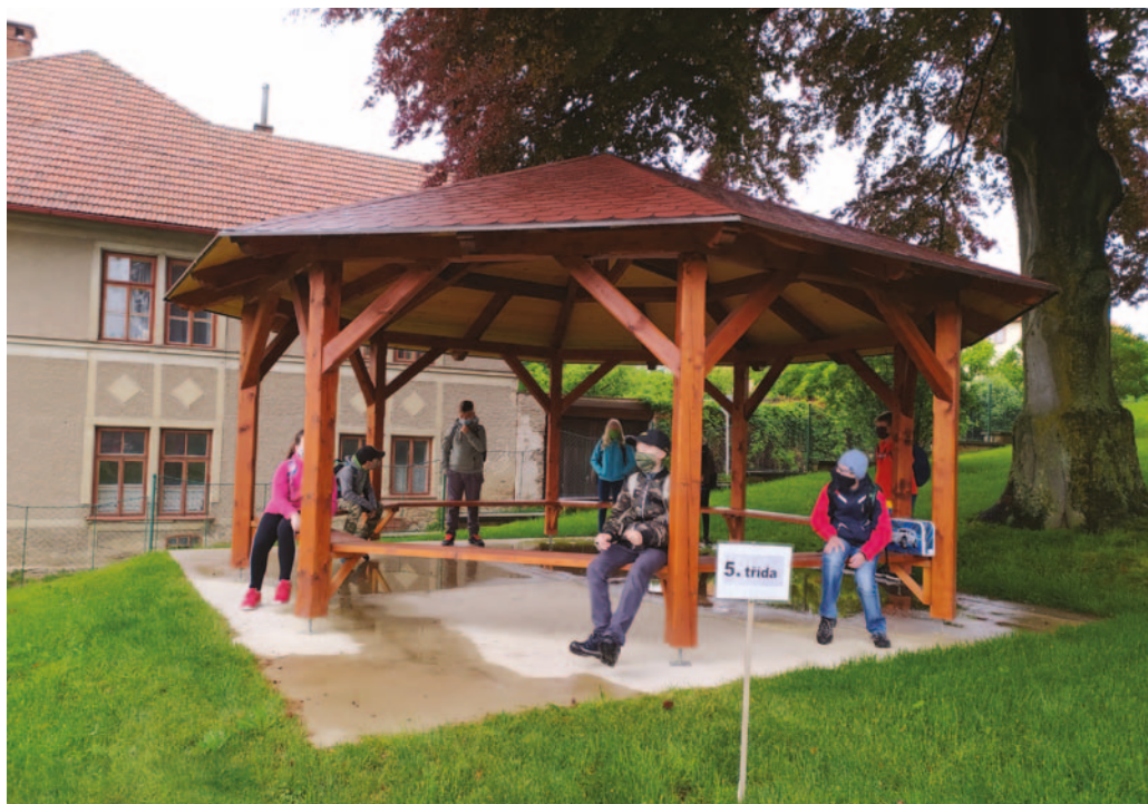
↑ Skupinka žáků 5. třídy čekajících na stanoveném odděleném a označeném místě na školní zahradě na pedagoga, který je odvádí do školy na vyučování.

Všichni doufáme, že ta zvláštní doba, kdy naše životy ovládla nejmenší a nejjednodušší forma živých organismů, už končí. Zkusme se podívat na to, co nám dala, co jsme se mohli naučit, dozvědět a změnit v našich životech především s ohledem na výchovu našich dětí. Zamyslíme se nad tím z pohledu rodiče dvou dětí školou povinných i z pohledu „školy“.