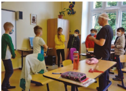
↑ Výuka žáků 4. třídy za dodržení přísných hygienických opatření.

Když 11.3. vláda rozhodla o uzavření škol, nikdo jsme si ani neuměli představit, jak dlouho tento stav potrvá. První myšlenky byly – Jak „to“ doženeme? Jak zařídít učení na dálku? Nikdo z nás nikdy v takové situaci nebyl. Učitelé, rodiče ani děti. Každý z nás je jiný, proto se naše představy lišily. Není možné se zavděčit a vyhovět všem. Viděla jsem to doma na svých vlastních dětech. Přístupy učitelů z jejich škol se lišily a já jsem přemýšlela, co je vlastně důležité, aby se v této době naučily. Mají umět vzory podstatných jmen a vzorce kyselin a hydroxidů? Nebylo by lepší, kdybychom toto „učivo“ nechali učitelům do školy, až se tam všichni vrátíme a naučili naše děti dovednosti, které by je vedly k větší samostatnosti?