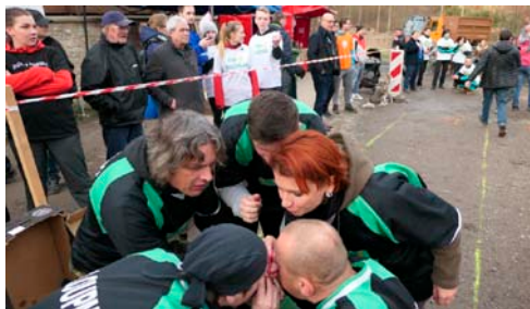
↑ Rozebírání brček u soutěže „Zahnutá svačinka v pivo aneb skvělá mňamka na závěr“

První finálová disciplína s názvem Obleč si svého řezníka aneb už je namol, ať