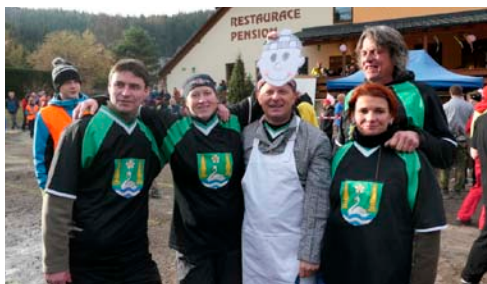
↑ V cíli po disciplíně „Obleč si svého řezníka aneb už je namol, ať táhne domů“