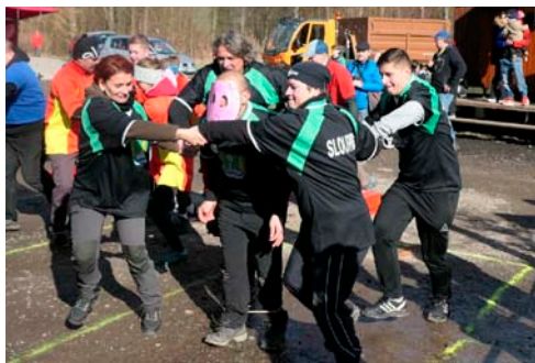
↑ „Nažeň prase aneb vezmi klacek, nesou necky“