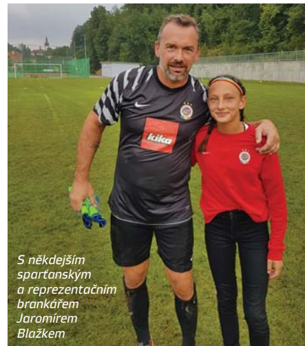
S někdejším spartánským a reprezentačním brankářem Jaromírem Blažkem