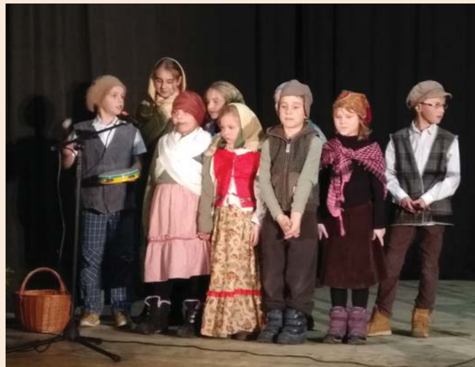
↑ Do programu přispěl i dětský farní sbor se svým adventním pásmem.