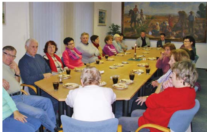
↑ Ze setkání seniorů na obecním úřadě.