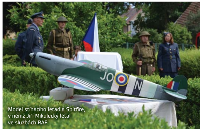
Model stíhacího letadla Spitfire, v němž Jiří Mikulecký létal ve službách RAF