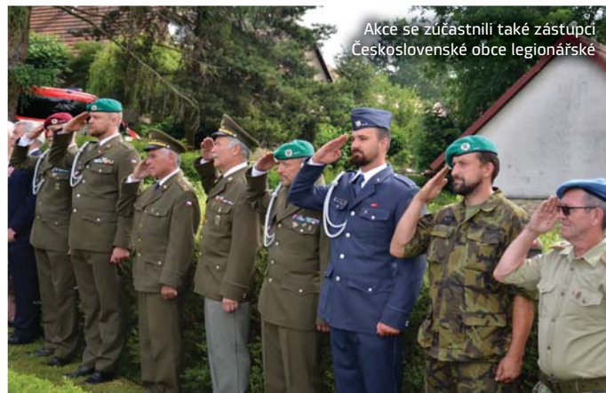
Akce se zúčastnili také zástupci Československé obce legionářské