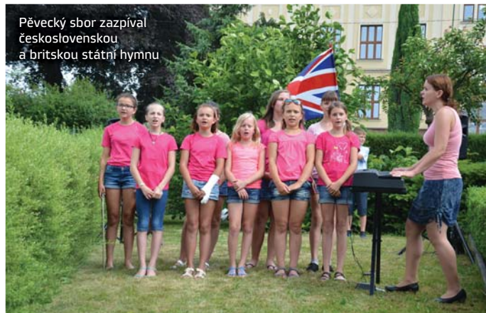
Pěvecký sbor zaspíval československou a britskou státní hymnu