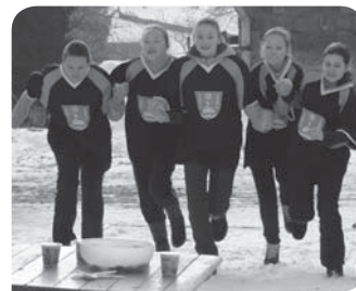
Pět děvčat reprezentujících Sloupnici běží ke stolu s jogurty a miskou plnou piškotů.