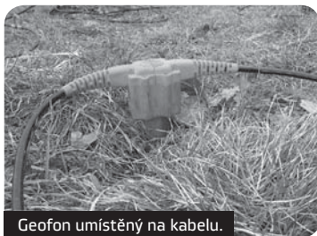
Geofon umístěný na kabelu.

Český stát zastoupený Českou geologickou službou začíná s novou etapou ochrany přírodního bohatství, které se nachází na území naší země, a to podzemní pitné vody.