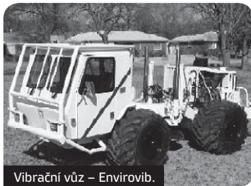
Vibrační vůz – Envirovib.

Hlavním cílem projektu „Rebilance zásob podzemních vod“ je přehodnotit přírodní zdroje podzemních vod s použitím moderních technologií ve vybraných kritických hydrogeologických rajonech, jež se nachází na cca 1/3 území České republiky, a současně připravit podklady pro systémové a pravidelné přehodnocování těchto zdrojů podzemních vod v budoucích desítkách let. Součástí tohoto projektu je také provedení geofyzikálního měření v oblasti mezi městy Vysoké Mýto, Lanškroun a Svítavy. Průzkum představuje 55 km 2D seizmických profilů ve třech částech.