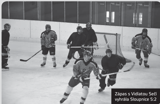
Zápas s Vidlatou Sečí vyhrála Sloupnice 5:2