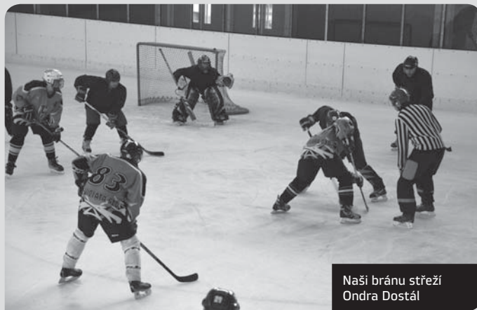
Naši bránu střeží Ondra Dostál