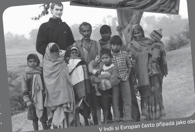
V Indii si Evropan často připadá jako obr.