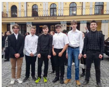
↑ Z návštěvy Klicperova divadla.