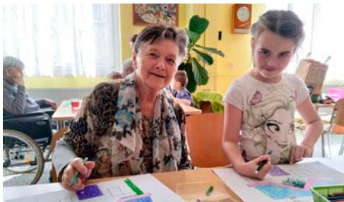
➤ V březnu jsme společně s dětmi z mateřské školy tvořili krásné obrázky.